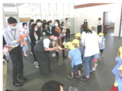
昨年の保健所での花の日の様子