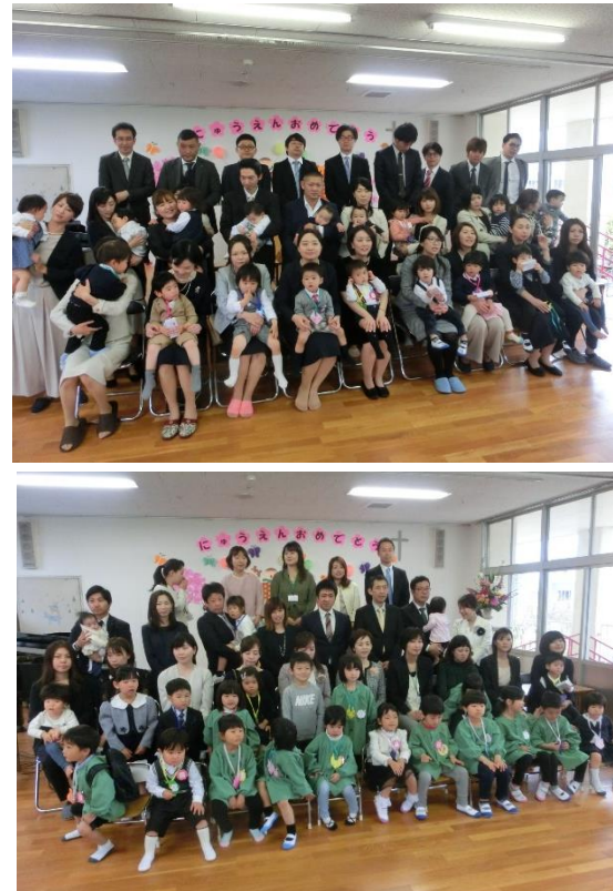
↑ みんなで 写真撮影しました

4月当初は、慣らし保育をする必要があります。入園は最初が肝心です。幼稚園って楽しいところだなあ、幼稚園の先生やお友だちって優しいなあと思ってくれることが何より大切です。そのためにも焦ることなく慣らし保育を致しましょう。お仕事の都合がおありの保護者もおられるでしょうが、ご協力をお願いいたします。