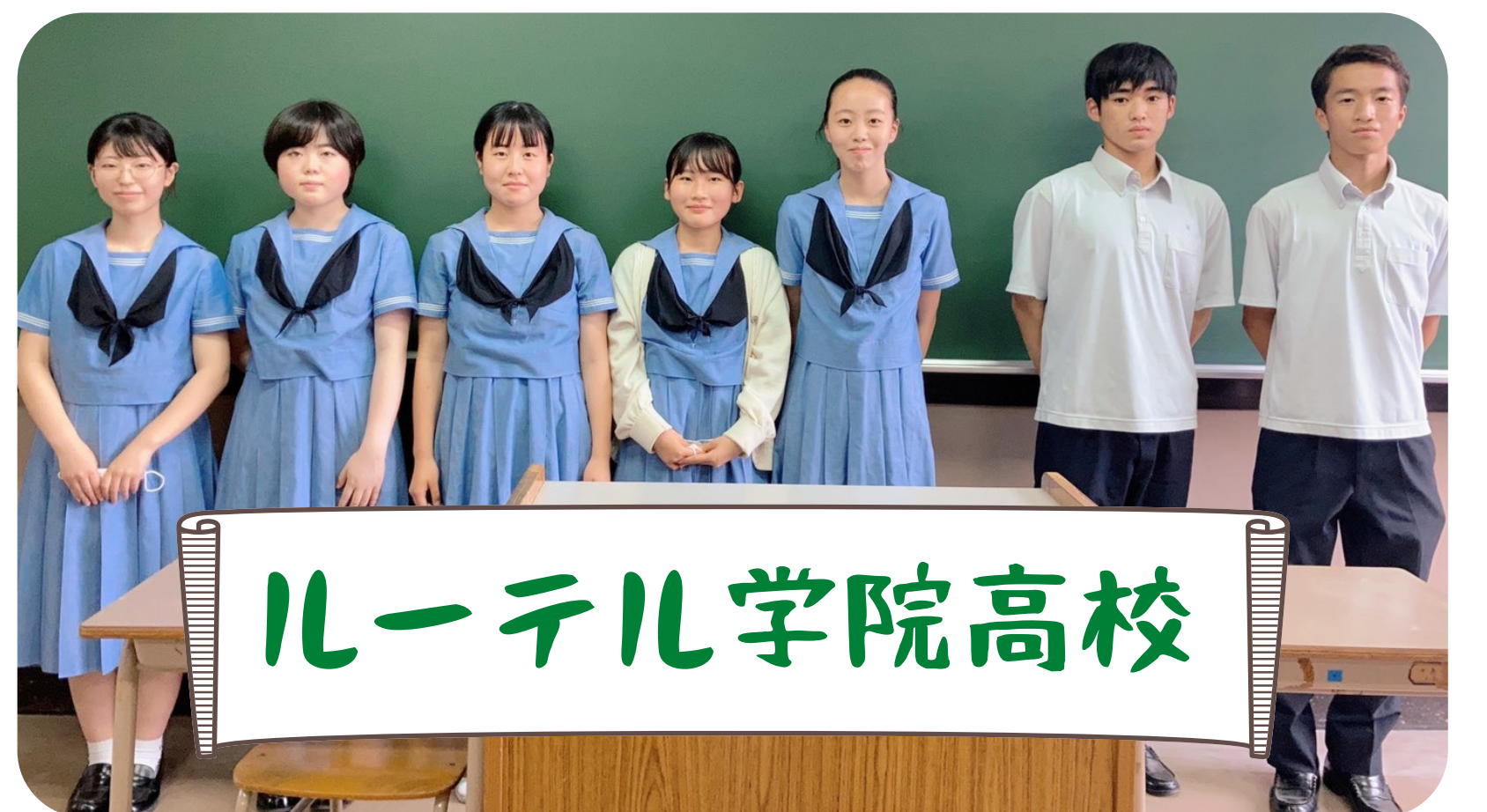
ルーテル学院高校

集まった資金は、自習室・イベント運営・ 清掃活動、広告宣伝等に使用させていただきます。 皆様のご支援をよろしくお願いいたします!